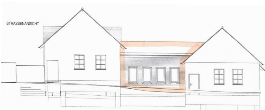
Die neue Straßenansicht (Zubau ist farblich markiert)