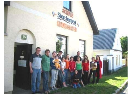
Die jetzige Straßenansicht

In den Jahren 2007 und 2008 werden daher 2 zusätzliche Klassenräume mit einer Fläche von 34 m 2 bzw. 39m 2 geschaffen und der Dachboden als Lagerraum nutzbar gemacht. Dadurch kann eine optimale Betreuung der Schüler gewährleistet werden.